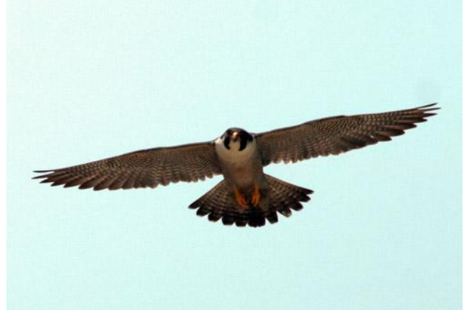
Faucon pèlerin

Face à cette situation, un programme pancanadien fut mis sur pied dès 1976 afin de contrer la chute drastique des populations de cette sous-espèce. Le programme de réintroduction a connu un grand succès et la situation de la sous-espèce anatum au Canada et au Québec s'est améliorée au point que son statut au niveau canadien est passé de « en voie de disparition » à « menacé » puis à « préoccupant » en 2007. Ainsi, et malgré une nette amélioration, la situation du faucon pèlerin demeure encore relativement précaire.