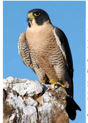
Faucon pèlerin adulte

En milieu naturel, le faucon pèlerin niche principalement sur les falaises ou dans des escarpements. Il ne construit pas de nid, mais s'installe plutôt directement sur les corniches naturelles, dans des dépressions peu profondes, sur la terre ou le gravier. Le nid est généralement localisé à partir de la moitié ou du tiers supérieur de la falaise. La présence d'espaces ouverts à proximité du site de nidification est chose commune, car les faucons pèlerins peuvent chasser efficacement leurs proies, c'est-à-dire des oiseaux qu'ils capturent en vol (ex. canards, bécasseaux, carouges à épauettes, etc.). Cette espèce s'adapte facilement à des sites urbains, nichant par exemple sur la structure des ponts ou gratte-ciel, surtout s'il y a présence d'un cours d'eau à proximité.