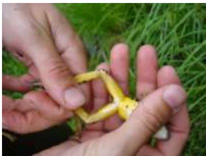
Grenouille des marais

La grenouille des marais est surtout terrestre, mais ne s'éloigne jamais beaucoup des plans d'eau ou des milieux humides, qu'ils soient ruisseaux, tourbières, étangs, lacs ou rivières. Elle se nourrit de petits invertébrés divers, d'insectes et d'araignées. Cet anoure est plutôt retrouvé en terrains montagneux et accidentés, ce qui limite ses déplacements. Pendant la saison hivernale, la grenouille des marais se terre dans la vase au fond des étangs et cours d'eau de faible profondeur et tombe en hibernation, période pendant laquelle elle ne respirera que par la peau. La grenouille des marais se reproduit en mai et juin, en milieu aquatique. Les œufs, se fixant à la végétation, éclosent de 4 à 21 jours après la ponte. La métamorphose des têtards a lieu en août et en septembre.