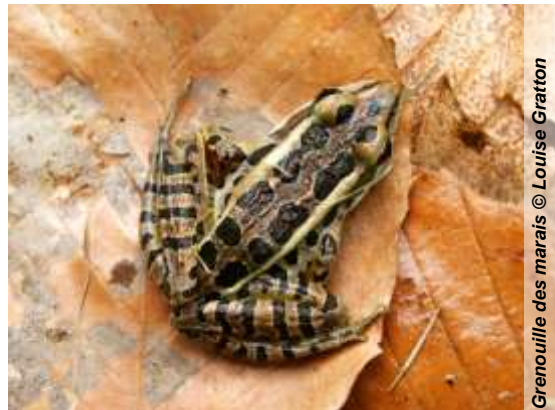
Grenouille des marais

La grenouille des marais ressemble beaucoup à la grenouille léopard, de laquelle on peut la distinguer par ses deux rangées de taches de forme rectangulaire sur le dos et sur les flancs, ainsi que par ses cuisses et ses aines de couleur jaune vif ou orangé. Aussi, la grenouille des marais ne dépasse guère 9 cm, tandis que la grenouille léopard mesure au maximum 11 cm. Lithobates palustris , à l'instar d'autres anoures, sécrète des substances nocives pouvant dissuader certains prédateurs.